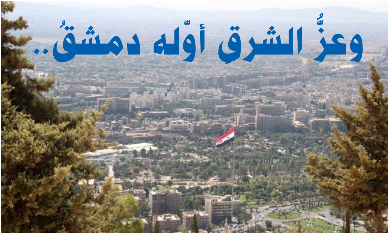
■ تصوير: تشرين - طارق الحسنية